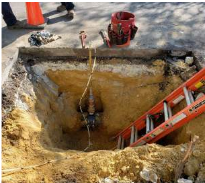
Figure 3: Tuyau taraudé avec tube de Pitot inséré. Mesures de vitesse prises en des points couvrant le diamètre intérieur du tuyau.

La moyenne des cinq tests C = 140.1, un résultat très encourageant, indique que le mortier de ciment fait toujours son travail, protégeant l'intérieur du tuyau tout en continuant à présenter une exceptionnelle surface "lisse" après un impressionnant 97 ans de service.