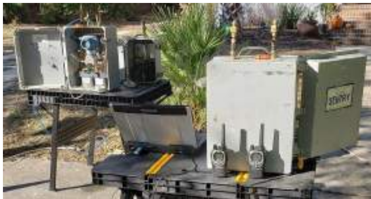
Figure 2: Débitmètres Sentry utilisés pour mesurer la vitesse et la perte de charge. À droite, le profil représentatif de l'écoulement turbulent dans une conduite