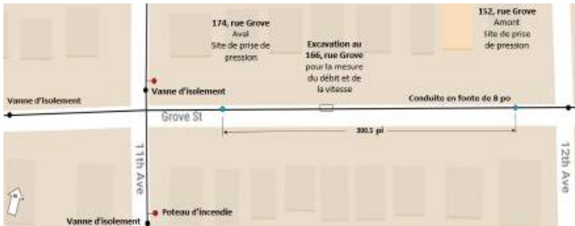
Figure 1: Plan du site d'essai sur la rue Grove: Plan schématique du test d'écoulement. La perte de charge et la vitesse sont mesurées à l'aide d'un enregistreur de pression différentielle Polcon Sentry connecté à des sites présélectionnés en amont et en aval. Le débit est stabilisé en fermant les vannes d'isolement appropriées et l'ouverture d'un poteau d'incendie à l'extérieur de la section de conduite à l'essai.